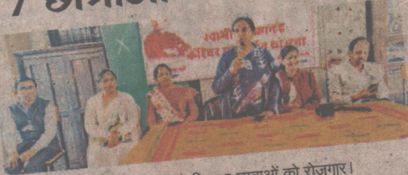
सागर. करियर प्लेसमेंट ड्राइव से मिला 7 छात्राओं को रोजगार।