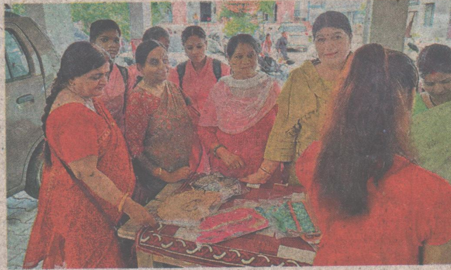
सागर। आजादी के अमृत महोत्सव के तहत गर्ल्स कॉलेज में विभिन्न कार्यक्रम हुए।