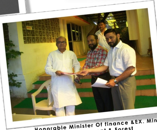
Honorable Minister Of finance & EX. Min of Environment & Forest Mr. Jayant Malaya