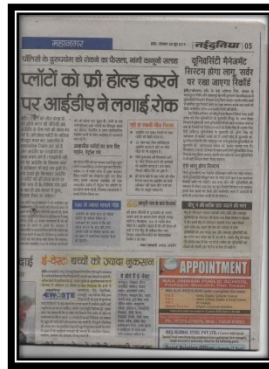
8 Jun 2015