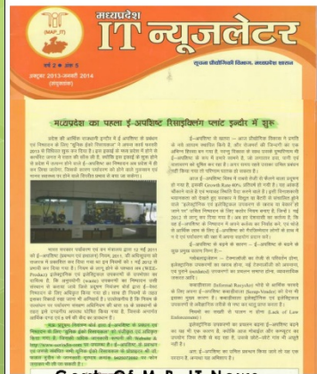
Govt. Of M.P. IT News letter