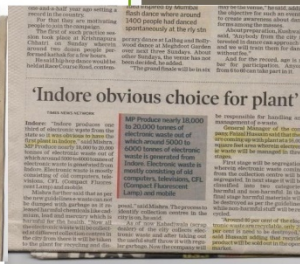
Times Of India News