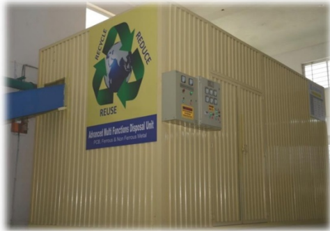
Our plant photo