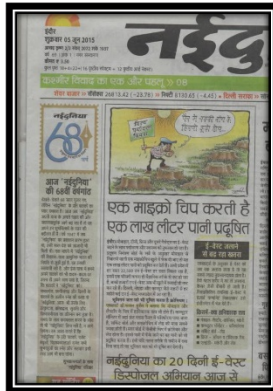
5 Jun 2015