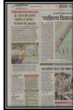
09 JUN 2015