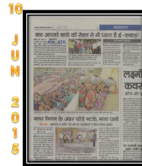
10 JUN 2015