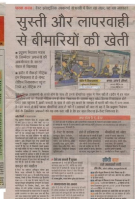
DB Star News