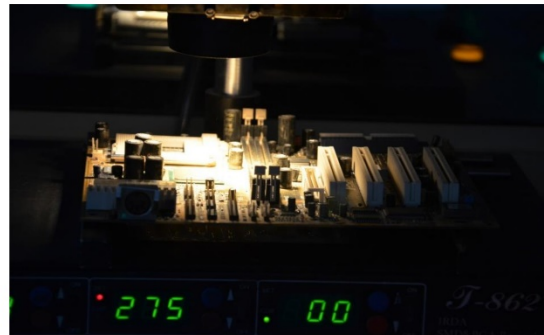
Our plant photo

Capacity:- 2800 integrated circuit per month