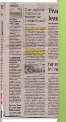
DNA Bhaskar News