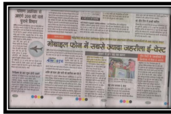
7 Jun 2015