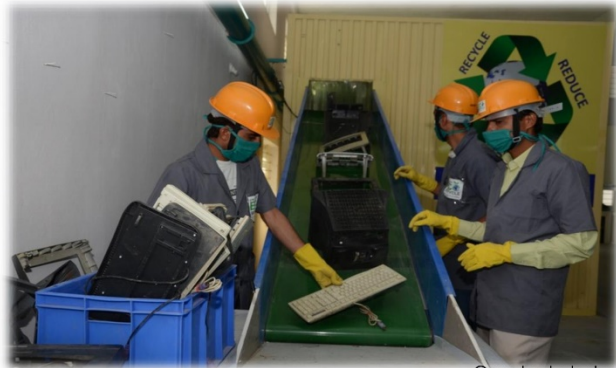
Our plant photo