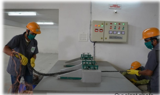
Our plant photo