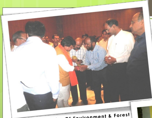
Honorable Minister Of Environment & Forest Mr. Kailash Vijayvargi