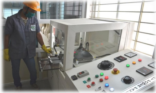
Our plant photo