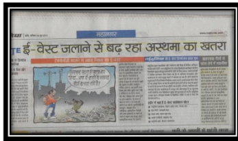
6 Jun 2015