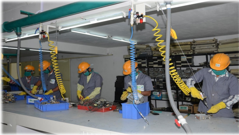
Our plant photo

✓ Advanced Dismantling Unit with Pneumatic tools.