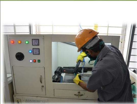
Our plant photo