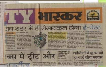
Dainik Bhaskar News