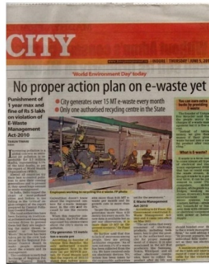
Free Press News