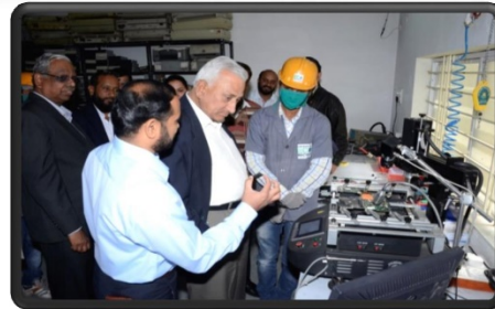
Members of pollution control board & other Govt. Officers