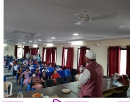
नगर विधायक का महाविद्यालय सत्रारंभ में आगमन

इस वेबिनार में विभिन्न प्रांतों के महाविद्यालयों से बहुत से विद्वान श्रोता ऑनलाइन से जुड़े हुये हैं।