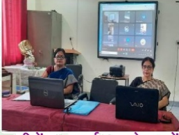
एक्सीलेंस गर्ल्स कालेज में एक दिवसीय वेबीनार का आयोजन